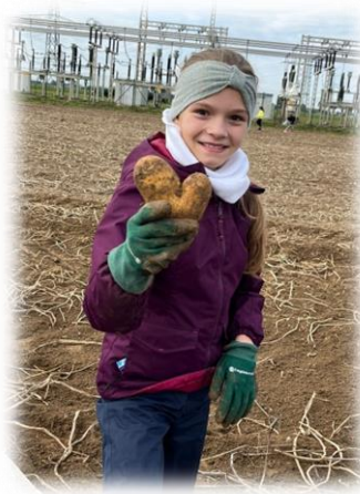
Besonders die Kartoffeln in Herzform hatten es den Kindern angetan.